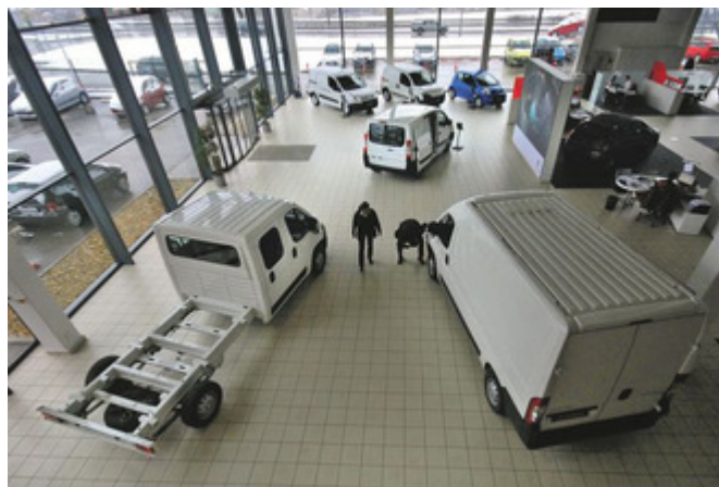
A hitelezési piac beszűkülése után tovább nőtt a flották aránya

Boros Jenő | Népszabadság | 2010. március 16. | nincs komment